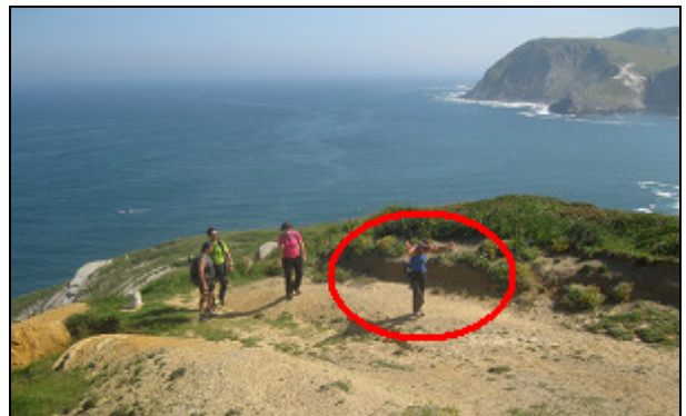
La alegría de Marga al encontrar la cámara