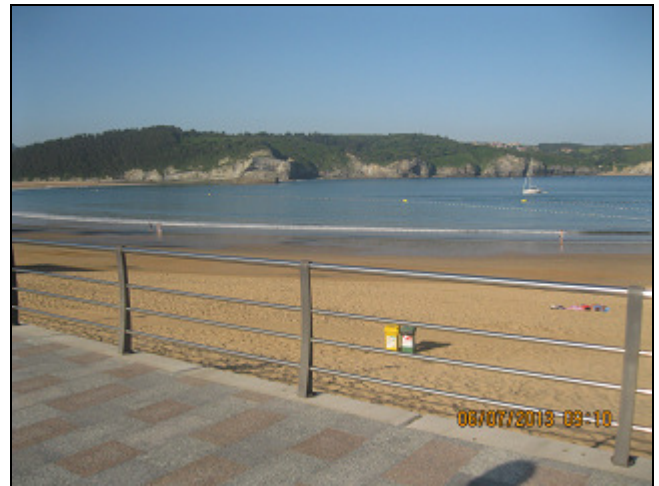
PLAYA DE GORLIZ