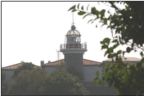
FARO DE PUNTA GALEA