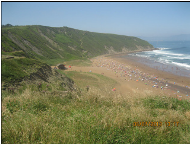
PLAYA DE BARINATXE (LA SALVAJE)