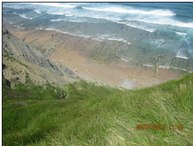
PLAYA DE BARRICA (PLAYA GRANDE O DE LAS ESCALERAS – 302 peldaños)