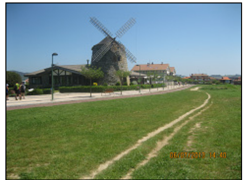
MOLINO DE AIXERROTA