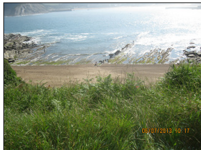
PLAYA DE MURIOLA" O "DE LA CANTERA