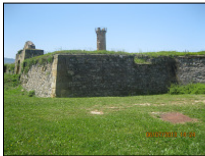
FUERTE DE LA GALEA