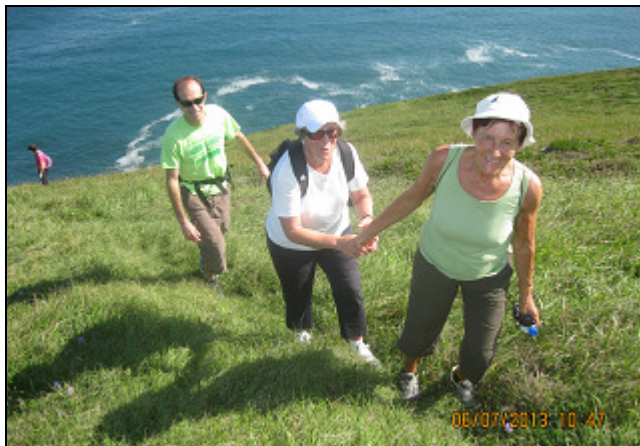
En "auresku" por el monte. ¡Esto es fuerza!