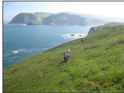
"Ottabarran (Argoma) artean"