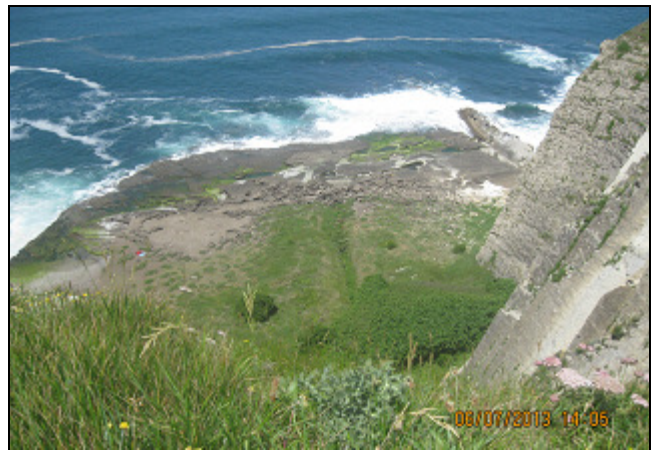
PLAYA DE GORRONDATXE / AZKORRI