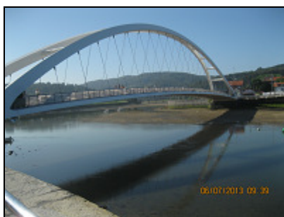
PUENTE ZUGAITZ (CALATRAVA)