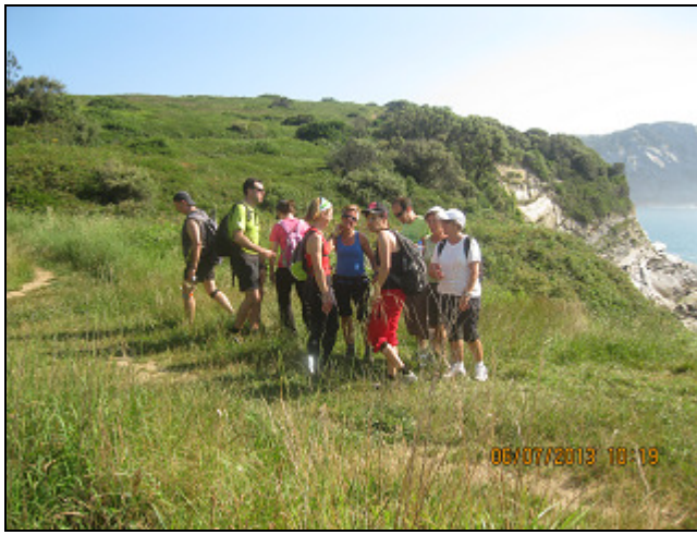
Foto de grupo