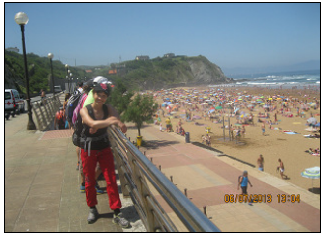
PLAYA DE ARRIETARA-ATXABIRIBIL