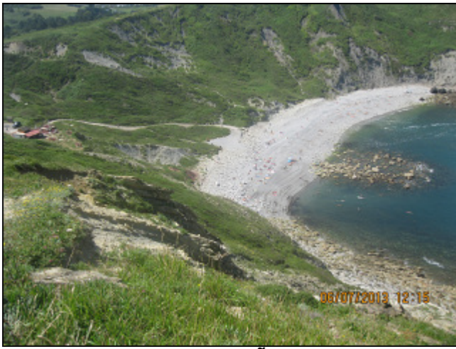
PLAYA DE MEÑAKOZ