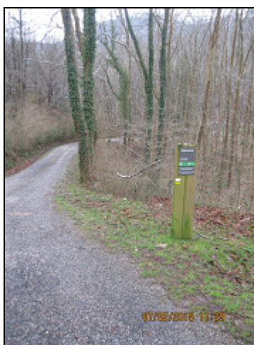
Aiako harria (Parke Naturala)