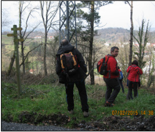
Por el atajo a Epele