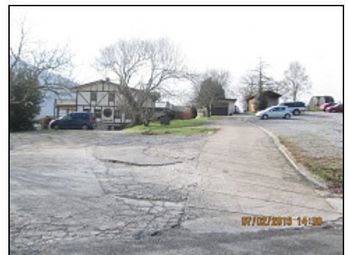
Larre gain sagardotegia