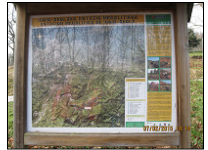
Igoin-Akolako estazio megalitikoak