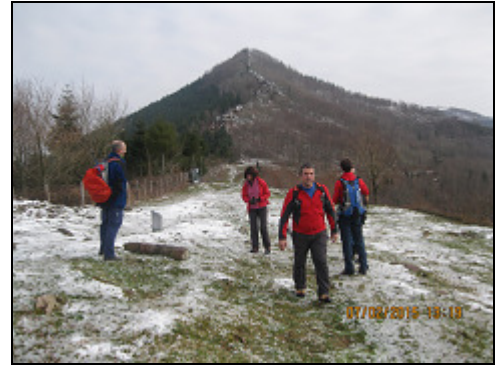
Al fondo, el "Igorin"