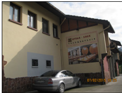
"Otsua enea sagardotegia. Junto al nuestro