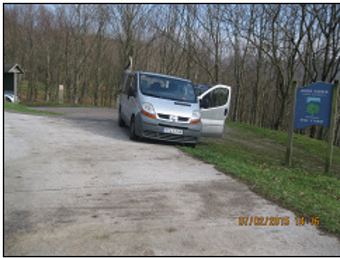
Aiako Harria. Parke Naturala