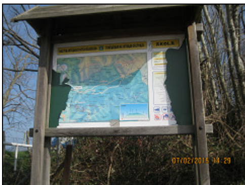
Itinerarios de interés cultural

Metak: Lurrean gauzak elkarren gainean jarriz egiten den pila, adierazten ez denean, haga baten inguruan biltzen den belar edo garo (helecho)