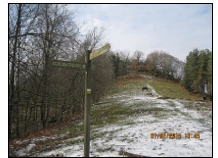
Indicaciones de los dólmenes