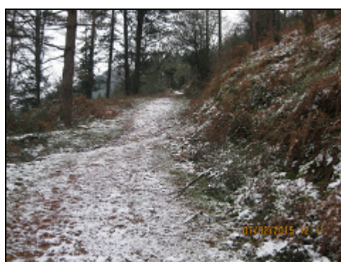
Un poco de nieve