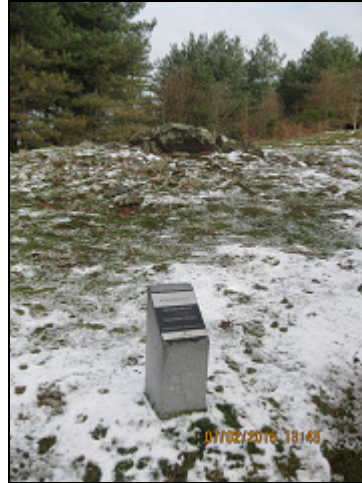
Akolako lepoa II Trikuharri