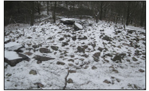
Igoringo lepoa I / Trikuharria