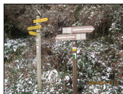
Igoringo lepoa (collado) (200m)