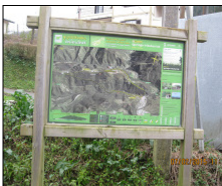
Cartel. Igoringo trikuharriak. PR-GI 1002