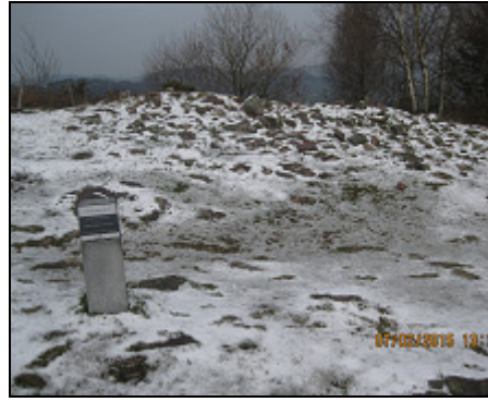
Igoringo lepoa II / Trikuharria