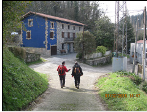
Punto de partida. Llegando al autobús