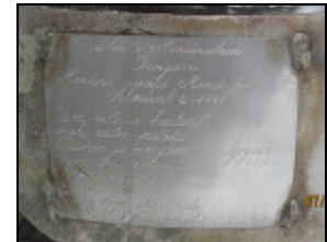
IGORIN (428 m)