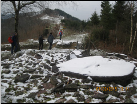
De nuevo en el trikuharri de Igorin