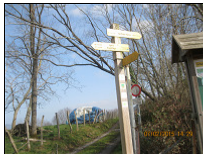
Epele 1,1 km