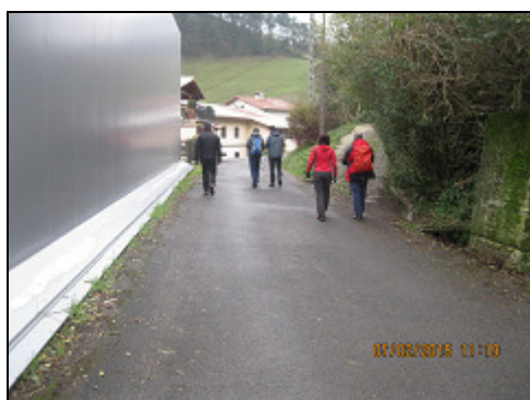
Comienza el recorrido