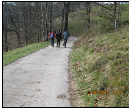
Cemento hasta el final